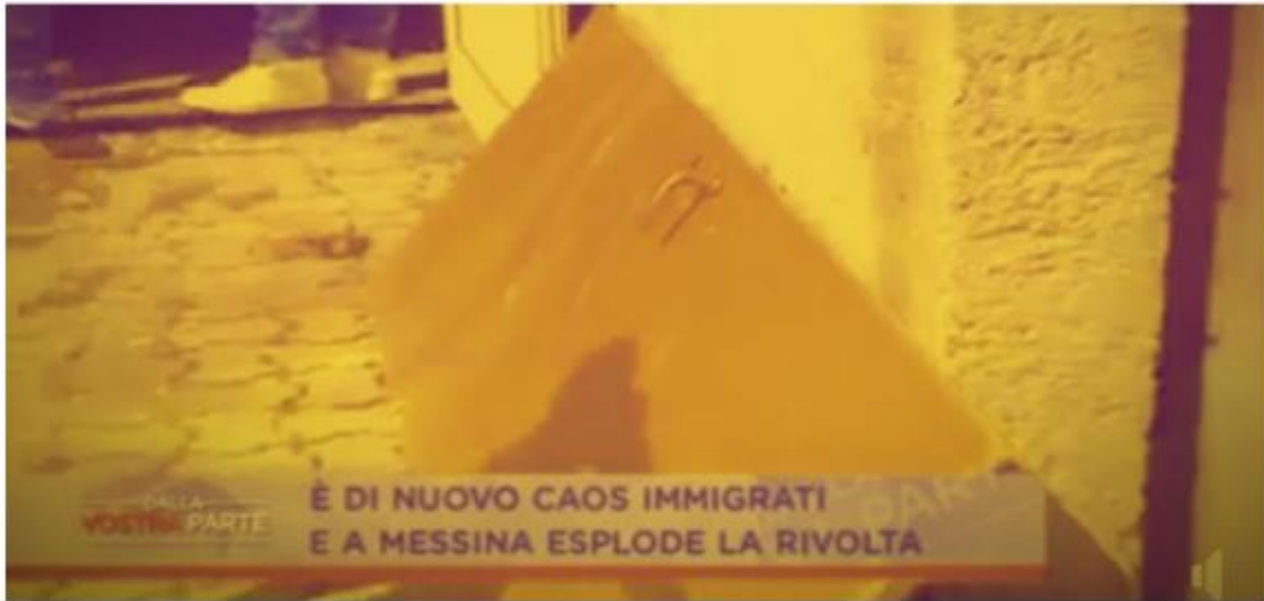
Notizia del 2016: la protesta in un centro di accoglienza in Sicilia